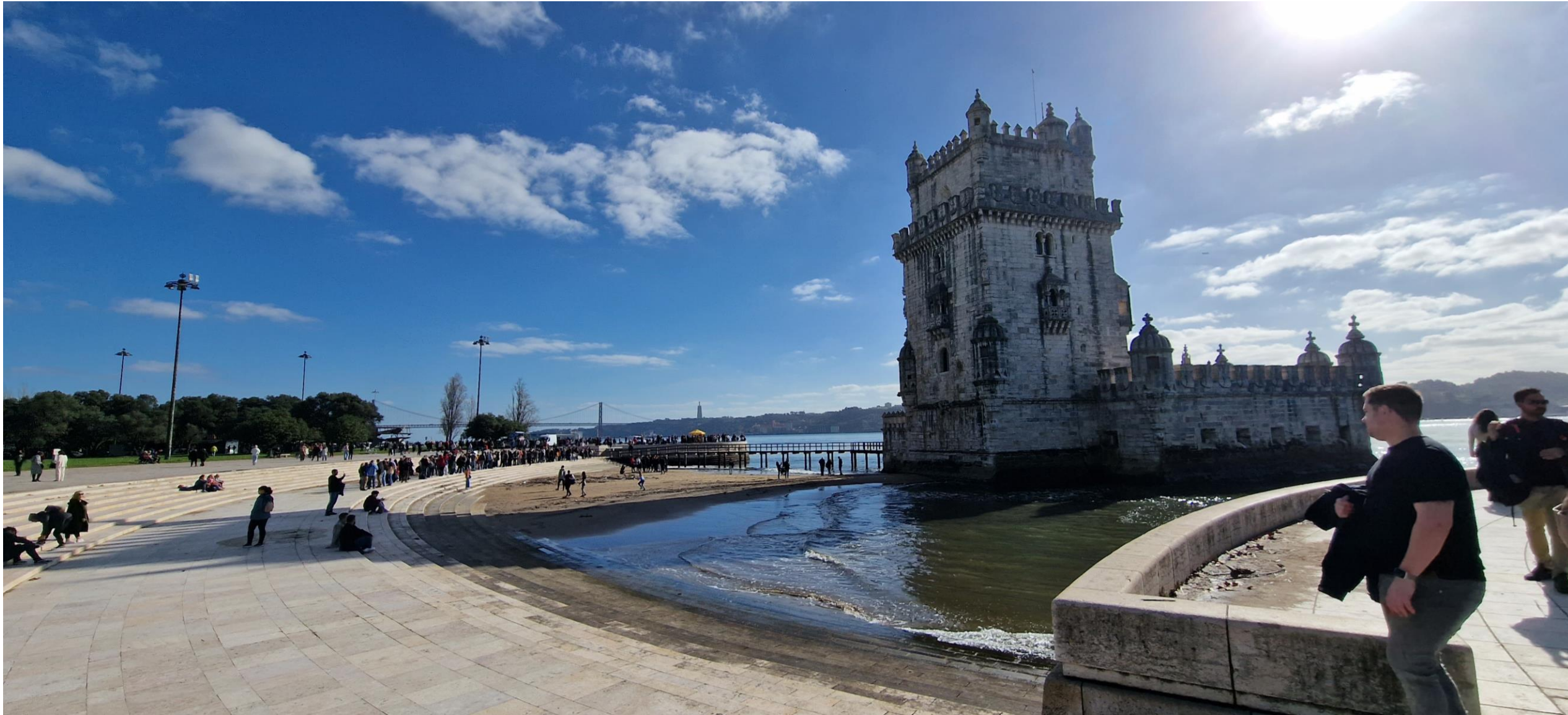
Toore de Belem